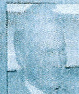
Claude Bébéar, l'ancien patron d'Asa, a parrainé la promotion 2009 des lauréats du réseau Entreprendre Lorraine. Extraits.

Sur la crise : "Tout le monde a dit 'il faut faire quelque chose', mais une fois la crise passée, c'est business as usual. Il ne faut pas trop de règles, mais il en faut. Et il faut les faire respecter. La grande nouveauté, c'est qu'il faut écrire des règles mondiales. L'Europe a un rôle à jouer, qu'elle a l'air de vouloir jouer."