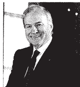
Claude Bébéar, l'ancien président d'Axa, récemment nommé à la tête du Comité de supervision des rémunérations créé par le Medef, sera le parrain de la promotion 2009 de Réseau Entreprendre Lorraine.

Celui qui a fait toute sa carrière dans le secteur de l'assurance des Mutuelles unies devenues progressivement le groupe Axa, vit la période faste et de croissance des années 80 avec surtout la crainte de la nationalisation du secteur de l'assurance. Ce climat lui permet de prendre le contrôle du groupe Drouot. A l'époque, Drouot est alors le premier groupe privé d'assurance. Claude Bébéar en prend alors la présidence, en même temps que celle des Mutuelles Unies. De fil en aiguille, la création du nom d'Axa arrive en 1985. De fusions en acquisitions, Axa s'affiche aujourd'hui comme le numéro un mondial du secteur de l'as-